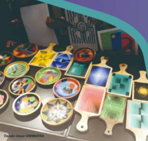
Desain dasar DWIMATRA

Proses membuat dalam suasana kuliah SENI KRIYA