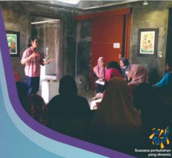
Suasana perkuliahan yang dinamis

Scan QR Untuk Informasi Pendidikan Seni Rupa Unismuh Makassar