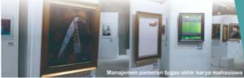
Manajemen pameran tugas akhir karya mahasiswa