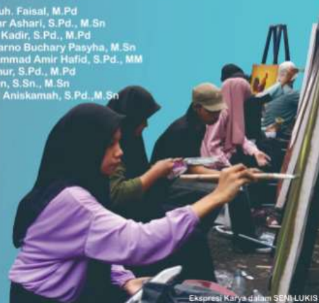
Eksresi Karya dalam SENI LUKIS